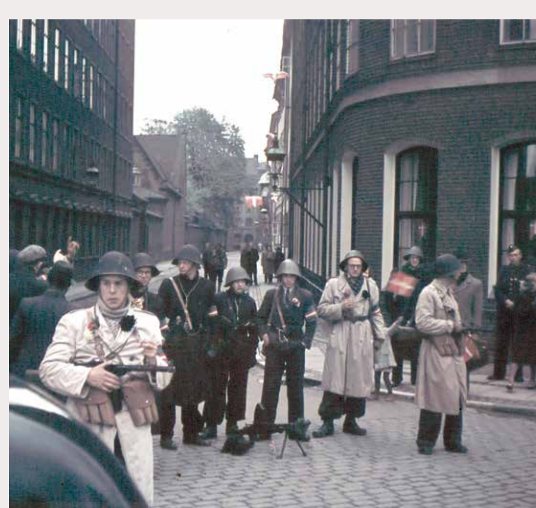
Freiheitskämpfer vor der Larslejsstræde Freedom Fighters at Larslejsstræde (Unbekannt · Unknown, 5. Mai 1945)

Until 1922, the church is equipped with stained glass windows. In 1938, a Sauer organ is installed. During the restoration from 1994 to 1999, the stained glass mosaics are replaced with clear glass windows.