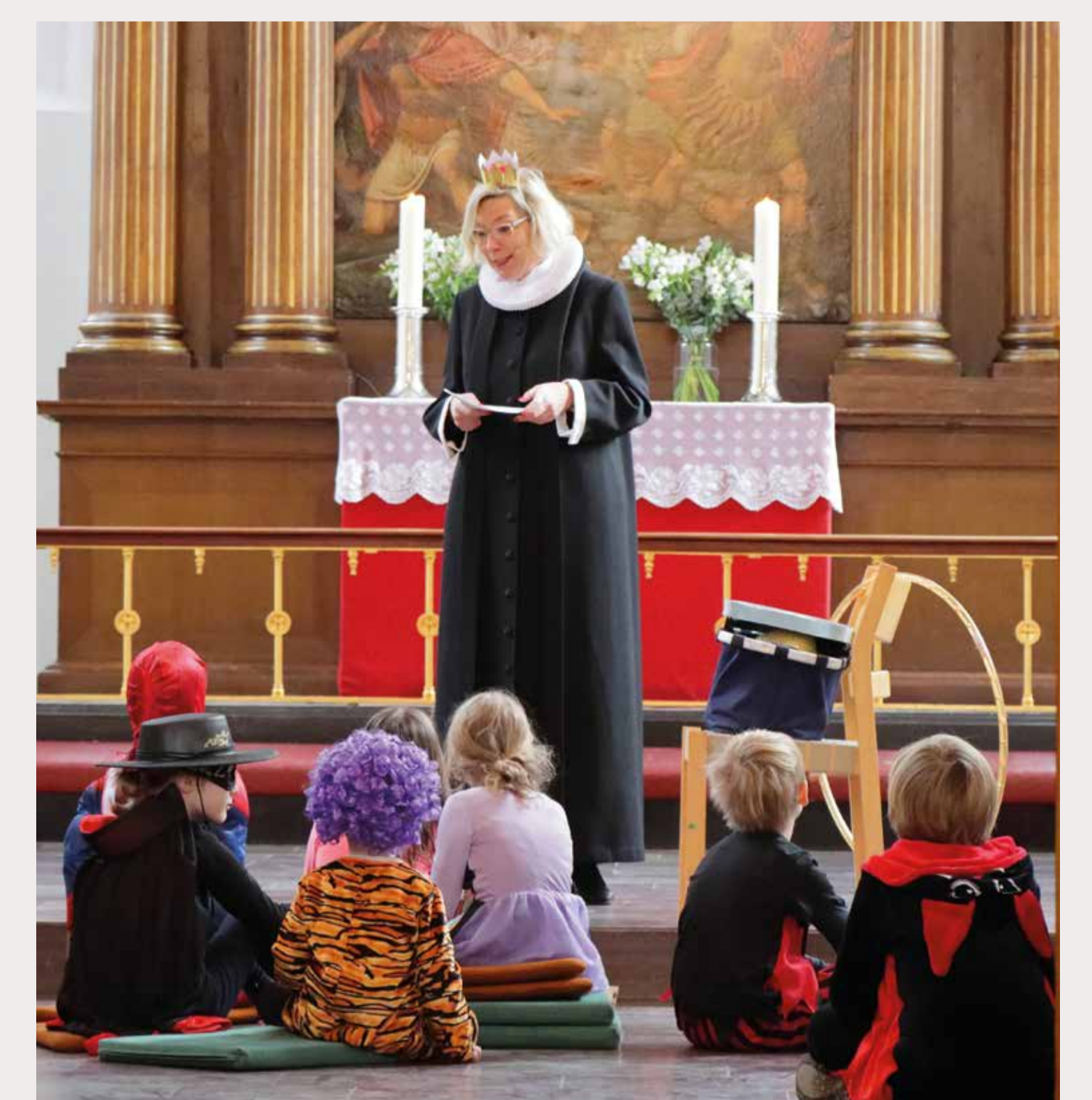
Groß oder Klein – alle sind heute Teil der Petri Mannschaft Big or Small – Everyone Is Part of the St. Petri Team Today (Christen Rindorf, 2024)

The school survives the war as the only German school in an occupied country, primarily thanks to Görnandt's efforts. He arrives in Denmark at the beginning of 1934. Pastor Görnandt personally cares for the German refugees who stream into Copenhagen.