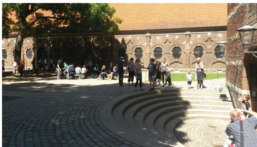
Ein Schauplatz des Festivals wird der Kirchhof der Sankt Petri Kirche sein

Dansk-Tysk Selskab ønsker at vise Tyskland i Danmark og vi håber, at du vil være med til at bakke op om arrangementet. Programmet er ikke færdigt endnu, men se mere på www.dansk-tysk-selskab.dk efter sommerferien.