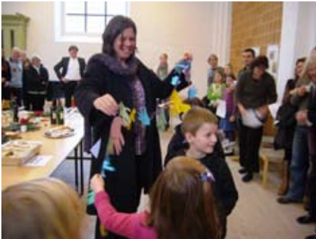
Die Kinder des Kindergottesdienstes mit ihrer Girlande aus Händen für ihren Kirchendiener