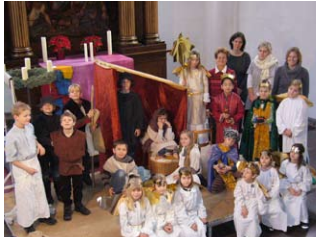
Alle 21 Kinder mit dem Vorbereitungsteam bei der Generalprobe