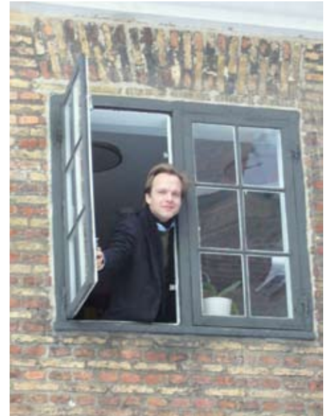
... der Blick aus dem Büro des Kirchenmusikers auf den Kirchhof bzw. Schulhof