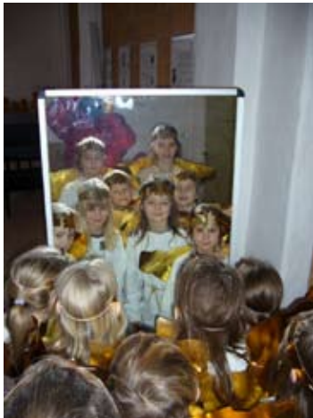
Spieglein, Spieglein, wer ist ...