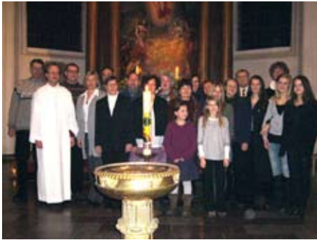
Der Projektchor 2010

Habt Ihr Interesse, die Osternacht mit Psalmen und anderen liturgischen Gesängen mitzugestalten? Dann meldet Euch an! Es sind keine besonderen Vorkenntnisse erforderlich.