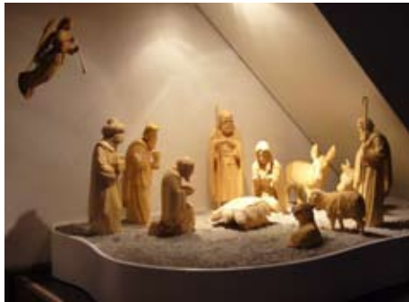
Die Krippenfiguren in ihrer Herberge unter der Kanzel

”100+X” in 2009 = eine neue Herberge für unsere Krippenfiguren