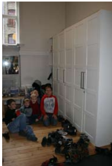
... der Vorraum des Bugenhagensaals - in voller Nutzung z.B. beim Kinderkirchentag!