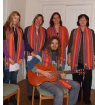
Ein Teil des Kindergottesdienst-Teams

Die nächsten Kinder- und Familiengottesdienste: jeweils um 11 Uhr: