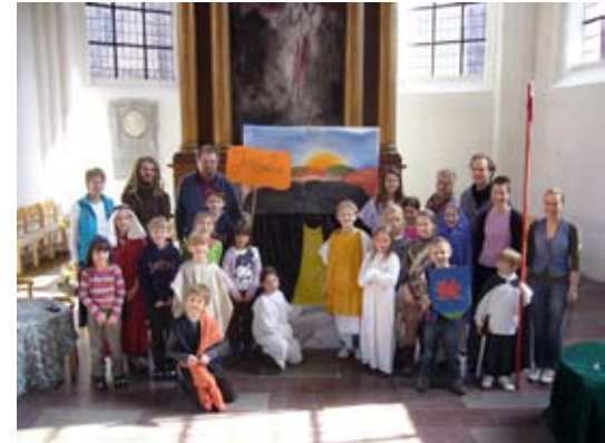
Alle Kinder und Musiker 2010 - ein Bild aus dem letzten Jahr!